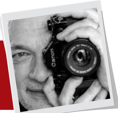
piše+foto: Zoran Lešić

MAŠTAM I SNIMAM SVOJ FOTOGRAFSKI DNEVNIK